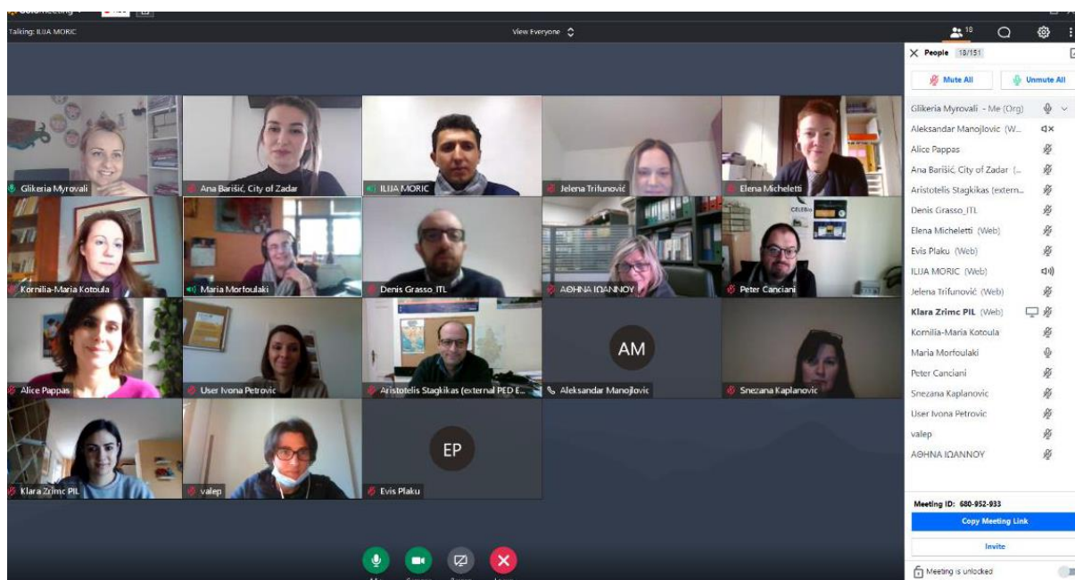
Prvi dan srečanja.

16. in 17. februarja 2021 je potekal tretji virtualni sestanek projekta SUSTOURISMO. Partnerji so srečanje izkoristili za razpravo o napredku projektnih dejavnosti, predvsem tistih na katere je najbolj vplival Covid-19 in pri tem izrazili upanje, da se razmere hitro izboljšajo.