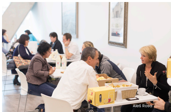
Jesenska borza lokalnih živil Osrednjeslovenske regije, Ljubljana 14.11.2018

Nekateri deležniki, ki sodelujejo v živem laboratoriju Ljubljanske urbane regije, med seboj sodelujejo že nekaj časa. Javne inštitucije, restavracije in manjši proizvajalci hrane zadnji dve leti poskušajo uskladiti svoje interese ter zbrati informacije o povpraševanju in ponudbi hrane v regiji. Sodelovanje se je pričelo v Ljubljani, cilj živega laboratorija, ki ga vodita raziskovalni partner Oikos ter izvajalec vsebin Regionalna razvojna agencija Ljubljanske urbane regije, pa je razširiti sodelovanje v celotni regiji z okoli pol milijona prebivalci.