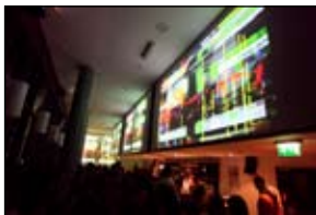
Otvoritveni teden Kina Šiška; Marko Batista: Paralelne digitalne strukture; foto: Miha Fras; vir: Kino Šiška